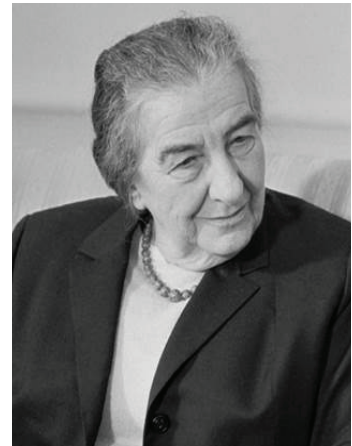
Golda Meir (Kiev 1898- Jerusalem 1978)

"El hombre que no odia la guerra no es totalmente humano."