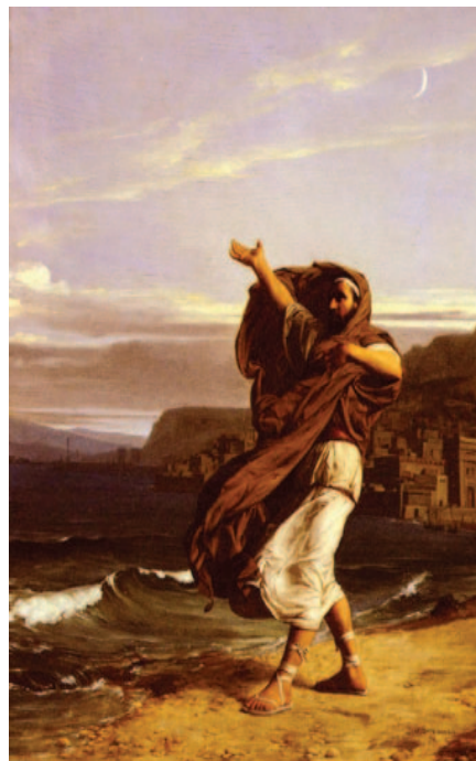
Demóstenes Practicando Oratoria por Jean Lecomte du Noüy (1842–1923).

Egresó del Instituto Pedagógico de Caracas en 1945 formando parte de la tercera promoción como Profesora de Biología y Química. Tuvo allí la extraordinaria oportunidad de recibir de la fuente primigenia las