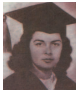
Grado en el Instituto Pedagógico en 1945.

Antes de graduarse ya comenzó su prácticas de docencia en el Liceo de Aplicación de Caracas y simultáneamente, hasta 1952 en el Liceo Fermín Toro.