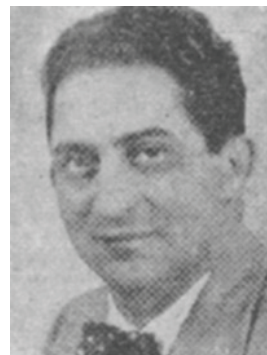
Profesor Fundador de la Cátedra de Clínica de Gastroenterología, octubre 1955.

En 1955 crea la Cátedra de Gastroenterología en la Universidad Central de Venezuela y en 1957 el Servicio en