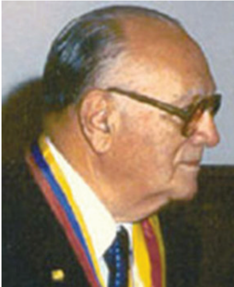
Presidente Encargado de Venezuela durante su período de Ministro.

117 ambulatorios, entre urbanos y rurales, 30 hospitales tipo I y II, además de la refacción de algunos hospitales tipo IV y V como el Hospital Vargas y el Hospital Clínico Universitario.