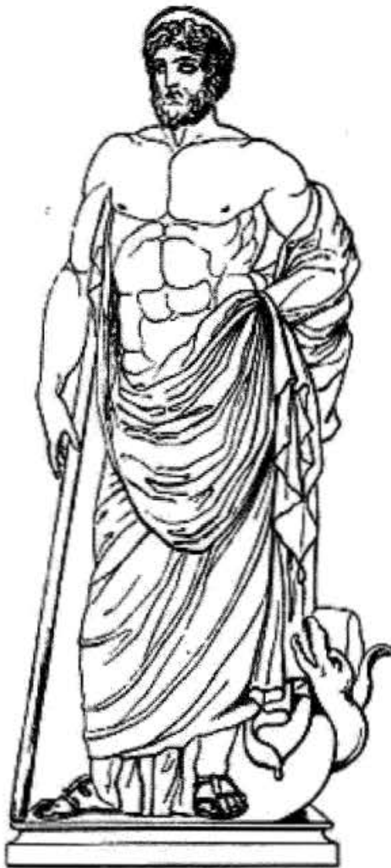
Figura 5. Representación de Esculapio, Padre de Hygeia. Obsérvese su representación como hombre maduro, aplastando al dragón o serpiente Pitón.

Asclepios se representa con el Caduceo (bastón con una serpiente enroscada) (Figura 5). Lo distingue por el arte de la Curación y sus atributos sobreviven hasta hoy como el signo de la profesión médica actual. El templo más importante de su culto estaba en Epidaurio en la Tesalia.