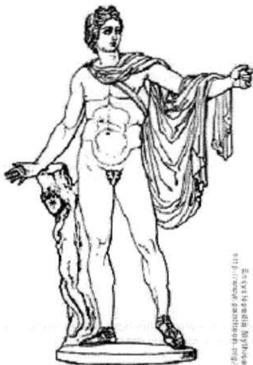
Figura 4. Representación de Apolo dios de las Curaciones y de la Medicina, adorado especialmente en el Oráculo de Delfos. Transmitía sus Profecías a través de las Pitonisas. Siempre se expresa como un adulto joven, con el bastón o caduceo y la serpiente o Pitón arrollada en el mismo. Apolo fue el padre de Esculapio y "abuelo" de Hygeia.

Zeus se enteró de la infidelidad de su marido se enardeció de celos al saber que Leto estaba embarazada. Buscando venganza Hera le prohibió a Leto dar a luz en cualquier sitio en contacto con la tierra (en tierra firme o islas) y encargó a la serpiente Pitón del Oráculo del Monte Parnaso de perseguir a Leto. Durante el embarazo Leto visitó numerosos sitios para su parto, y pudo encontrar la isla de Délos en el Mar Egeo como sitio apropiado para dar a luz a sus gemelos, porque Délos se consideraba una isla flotante sobre el mar, difícil de alcanzar por las fuentes corrientes submarinas. Por este hecho estaba fuera de las prohibiciones de Hera. Sin embargo, en el trabajo de parto Hera retuvo a Electilla la diosa del Parto. Sólo por el clamor de los otros Dioses del Olimpo pudo al fin Leto parir sus gemelos. Primero dio a luz a Artemisa y posteriormente a Apolo. Lo primero que hizo Apolo al nacer fue matar a la serpiente Pitón por la persecución que había hecho a su madre. Al matar Apolo a la serpiente Pitón fue condenado a cuidar los rebaños del Rey Atmetus por 9 años. Luego de cumplir el castigo pudo tomar el control del Oráculo del Delfos en el Monte Parnaso.