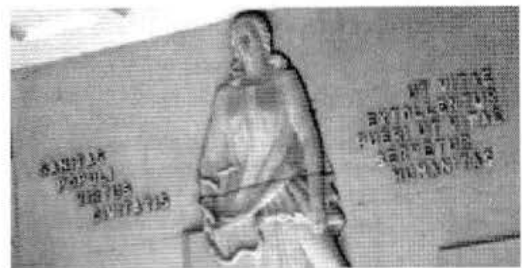
Figura 2. Hygeia representada modernamente como una mujer joven, con la serpiente Pitón en su brazo derecho.