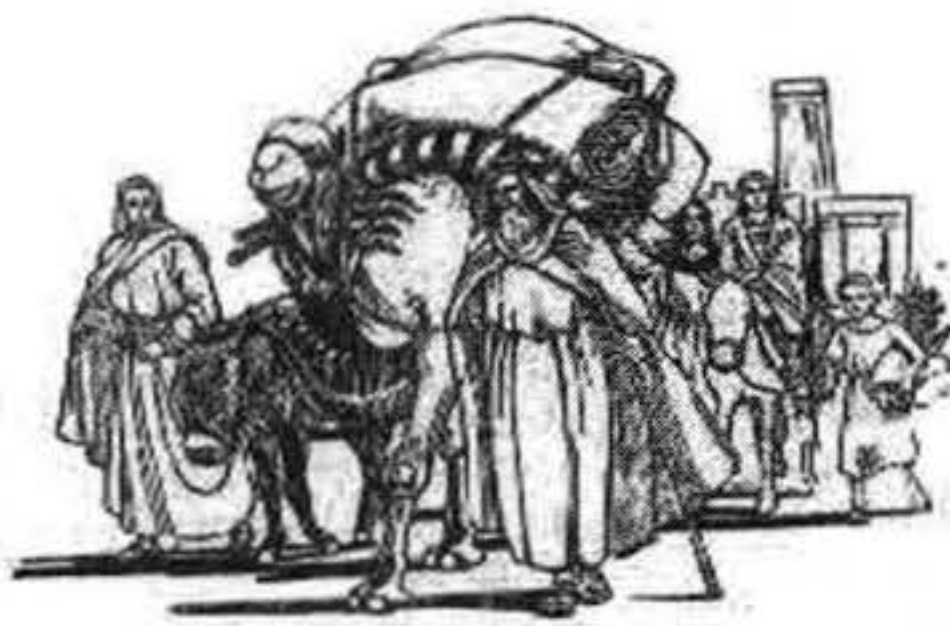
Figura 2. El Patriarca Abraham abandonando Ur en dirección a Canaán.

Podemos remontar su origen hace cuatro mil años cuando el Patriarca Abraham de Ur, Caldea se traslada a Canaán. Hebreo significa el que atravesó el río (Figura 2).