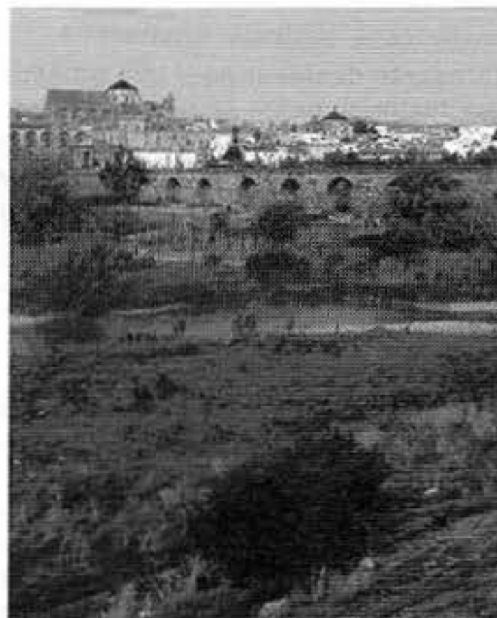
Figura 5. La ciudad de Córdoba con el Guadalquivir y el puente romano.

César nunca pudo cruzar porque los hijos de Pompeyo lo destruyeron. Córdoba fue la segunda ciudad importante después de Constantinopla durante el imperio Bizantino (Figura 5). Poseía unos tres kilómetros de murallas. Fue romana desde el año 200 a.C. hasta el siglo V d.C. Los cartagineses precedieron a los Romanos. No aceptaron a César a pesar de sus varias paradas que realizó en Córdoba. Los Bárbaros con Leovigildo a la cabeza en el año 672 saquean a Córdoba. Siguió el período de los Emiratos entre el 711 al 912 de la era común. El emir Al-Horr en el año 716 establece en Córdoba la cabeza de España. Prosiguió Abderramán (756-788) quien comenzó la construcción de la mezquita declarada por la UNESCO monumento de la humanidad. Se inauguró en el 793. Recordemos que Córdoba fue cuna el obispo Osío, eminente intelectual, Séneca (3 a.C.-65 d.C) con una productividad literaria poco común. Averroes (1126-1198) jurisconsulto, médico y filósofo y finalmente Maimónides, quien recibió luces entre otros de Averroes, quien a su vez fue instruido por Maimónides en el Talmúd siendo este 10 años menor.