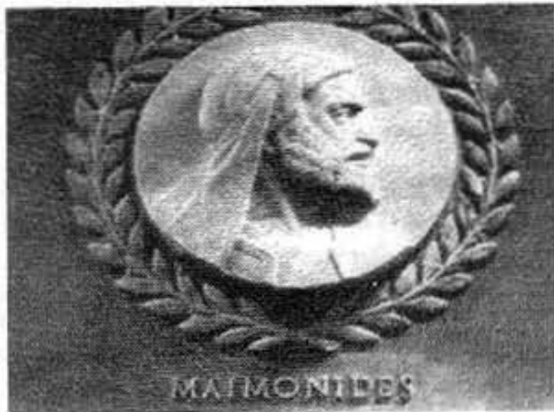
Figura 1. Maimónides.

¿Quién es sabio? El que aprende de todos ¿Quién es fuerte? El que domina sus pasiones ¿Quién es rico? El que se regocija con sus partes ¿Quién es respetado? El que respeta las criaturas. TALMUD