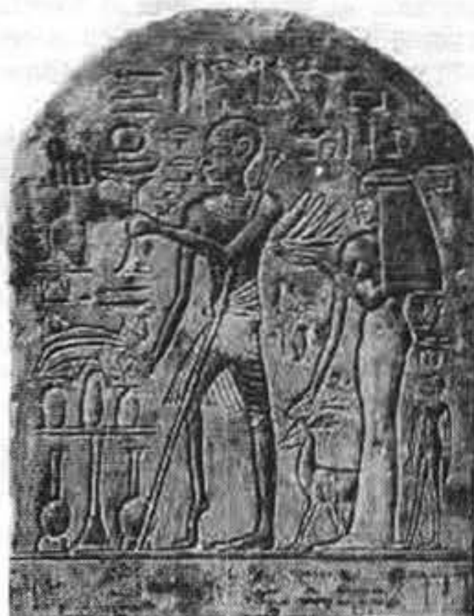
Figura 3. Estela egipcia de alteración del miembro inferior izquierdo atribuido a enfermedad de Little o trauma congénito y no a accidente cerebro-vascular o polio como erróneamente se hace.

Una declaración del Rey Ciro en el año 538 a.C. libera a los judíos y los conduce a Israel. Se construye entonces el segundo Templo desde el 538 a.C. Al 70 d.C donde se asienta la nación soberana judía. La dominación persa cedió paso a la civilización helénica, hubo una reacción a la aceptación de los nuevos dioses y fue la familia de Los Macabeos (Matatías y sus hijos) se rebelaron y restablecieron la dinastía de los Jasmoneos. El término judaísmo aparece por primera vez en el segundo libro de los Macabeos y que dieron origen a la festividad de las luces o Janucá.