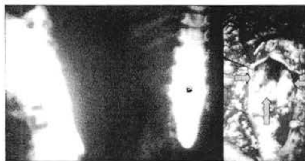
Figura 3. A. Mielograma yodado que demuestra el aumento de los diámetros del espacio aracnoideo lumbar y en AP la parte menos densa del tallo óseo en 1.3 que el yodo rodea. B. Campo quirúrgico donde se ven ambas hemimédulas (flechas horizontales) y el tallo óseo medial (flecha vertical).

El 01-11-91 se sometió a cirugía donde se hallaron las láminas vertebrales intactas desde L2 a L4 que se extirparon con rongeur. Se abrió la duramadre y se visualizaron ambas hemimédulas y el espolón óseo medial que se extirpó cuidadosamente con rongeur fino y fresado hasta su inserción en la cara posterior del soma L3 (Figura 3B).