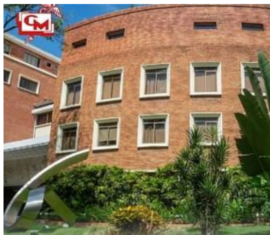
Centro Médico de Caracas

La mayoría de los ponentes, hizo cordial referencia adicional, a diversas situaciones y experiencias asistenciales, docentes u organizativas, en las cuales habían compartido actividades con el epónimo, en actividades relacionadas con la Pediatría Social,