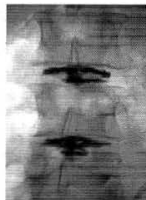
Fig. 2a y 2b. Discografía de L3-L4 y L4-L5 donde se demuestra ruptura de ambos discos con paso del medio de contraste hacia el conducto raquídeo limitado por el ligamento longitudinal posterior en proyección posteroanterior y lateral. DALLAS 4. El disco L4-L5 reprodujo el dolor clínico del paciente.