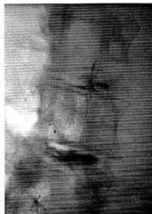
Fig. 3a y 3b. Discografía de L3-L4 y L4-L5 en proyección lateral y posteroanterior, donde se demuestra a nivel de L3-L4 ruptura del disco con paso del medio de contraste hacia el conducto raquídeo limitado por el ligamento longitudinal posterior. DALLAS 5. A nivel L4-L5 se demuestra ruptura del disco DALLAS 4. El disco L3-L4 reprodujo el dolor clínico del paciente.